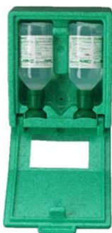
Plum ögonsköljskåp dammskyddat 18-7025-08 med uppvärmning 12 VDC 18-7025-09