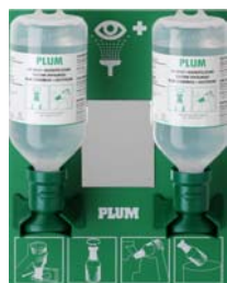
Plum ögonsköljstation 2 flaskor artikelnr 18-7025-06 4 flaskor artikelnr 18-7025-05