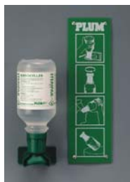
Plum 1 flaska 18-7025-01

Ögonsköljflaskor uppfyller EUs direktiv för medicinska produkter och är märka med CE-märke och kontrollorganets sifferbeteckning.