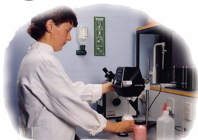
För snabb insats bör flaskor placeras intill arbetsplatsen.

Alkaliska skador – tvättmedel och andra basiska ämnen 10-15 minuter