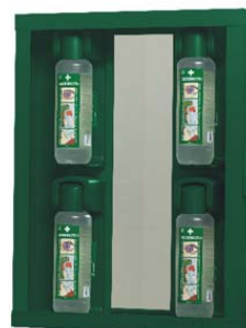
Skåp Cederroth inkl spegel 18-7025-14 OBS! Flaskor beställs separat