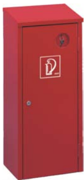
Plåtskåp med nyckellås

Ett komplett program varsel- och utrymnings-skyltar. Begär separat prospekt och prislista.